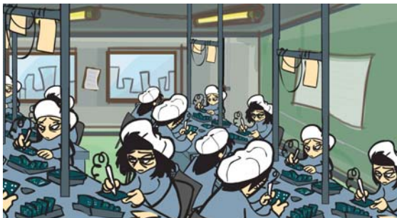
Arbeiterinnen bei dem Kontraktfertiger „FOXJ“

Für die Petition mobilisieren Organisationen aus Deutschland, den Niederlanden, Österreich, Spanien, Tschechien und Ungarn.