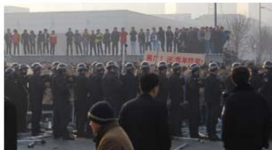
The strike at United Win on 15 January 2010. Police were deployed to intervene.

Ein Streik von 2 000 Arbeitern hat massive Vergiftungsfälle in dem Unternehmen United Win öffentlich gemacht. Die Firma ist ein Tochterunternehmen von Wintek Corporation und ein Kontraktfertiger für Apple, ansässig in Ostchina. SACOM hat den Fall in seinem neuen Report untersucht. Der Report in englischer Sprache zum Download hier .